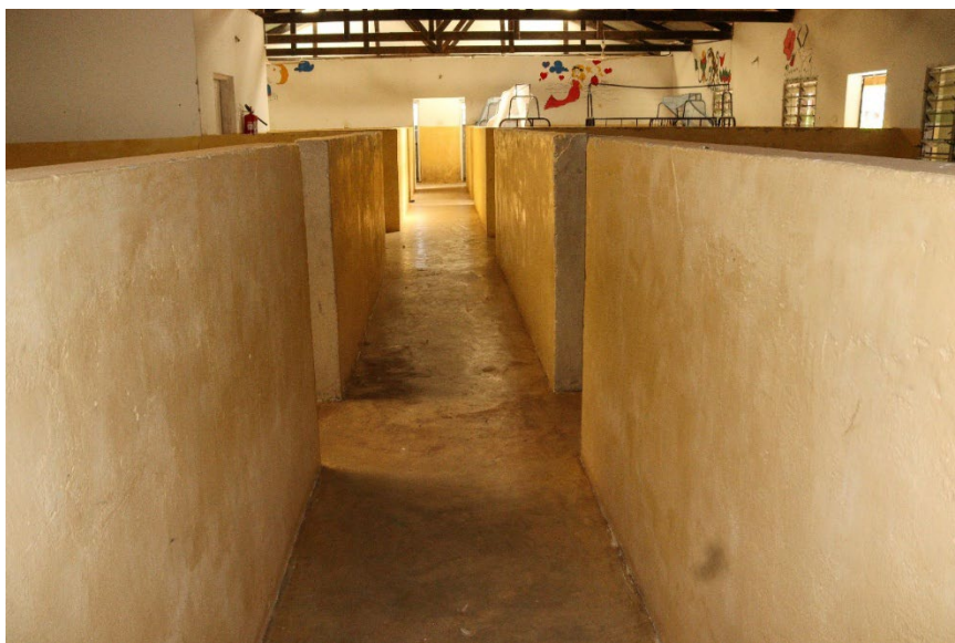
Slaapzaal gebouw die wij gaan ombouwen